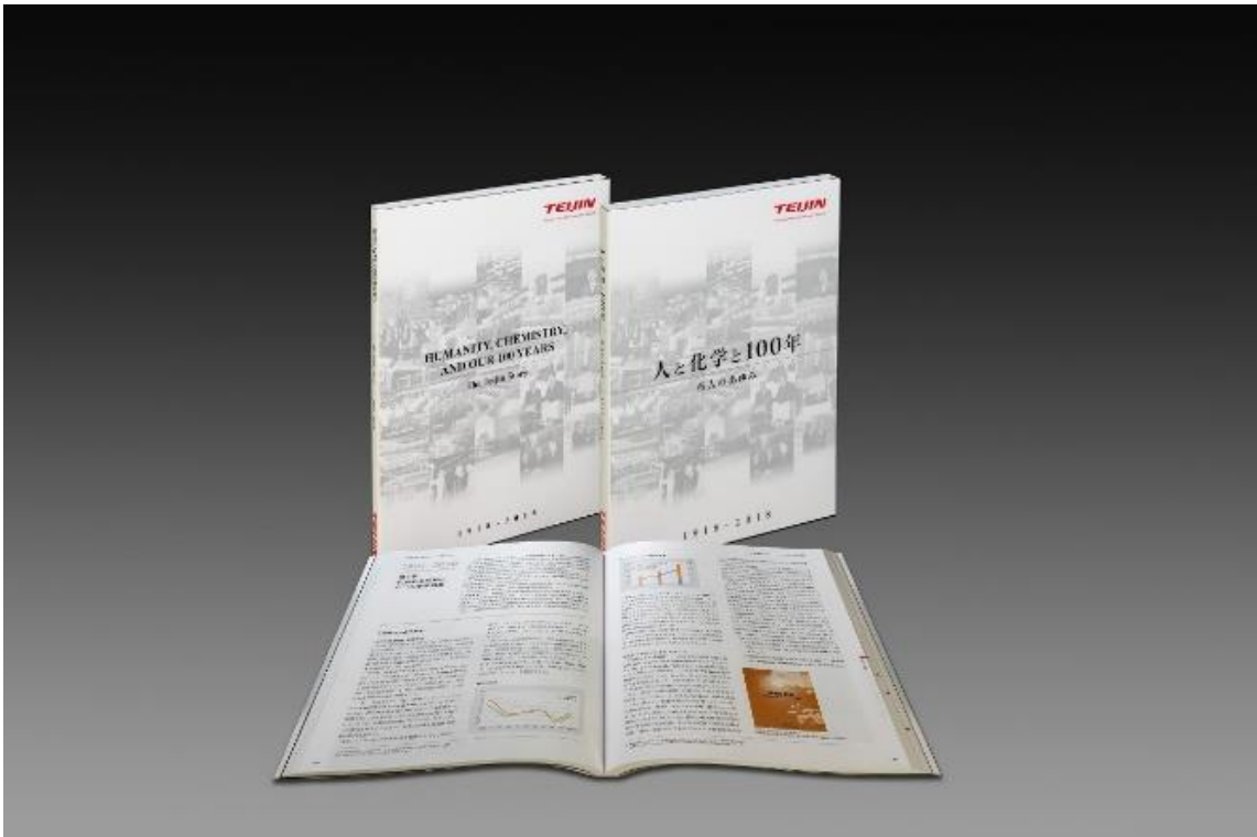
『人と化学と 100 年 帝人のあゆみ 1918-2018』